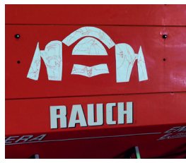
Maschinen Logo und Eisenblüte