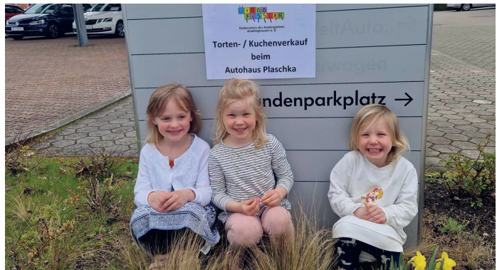
Die Vorfreude ist groß.