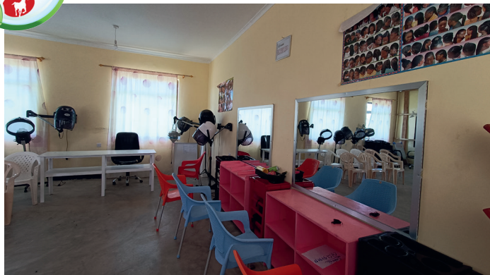
Neue Ausbildungswerkstatt für die Durchführung von Ausbildungen im Friseur- und Kosmetikhandwerk bei der Bildungseinrichtung SabaSaba in Singida, Tansania. Die Ausstattung wurde durch den Verein Straßenkinder Tansania und die niedersächsische Bingo-Umweltstiftung gefördert!