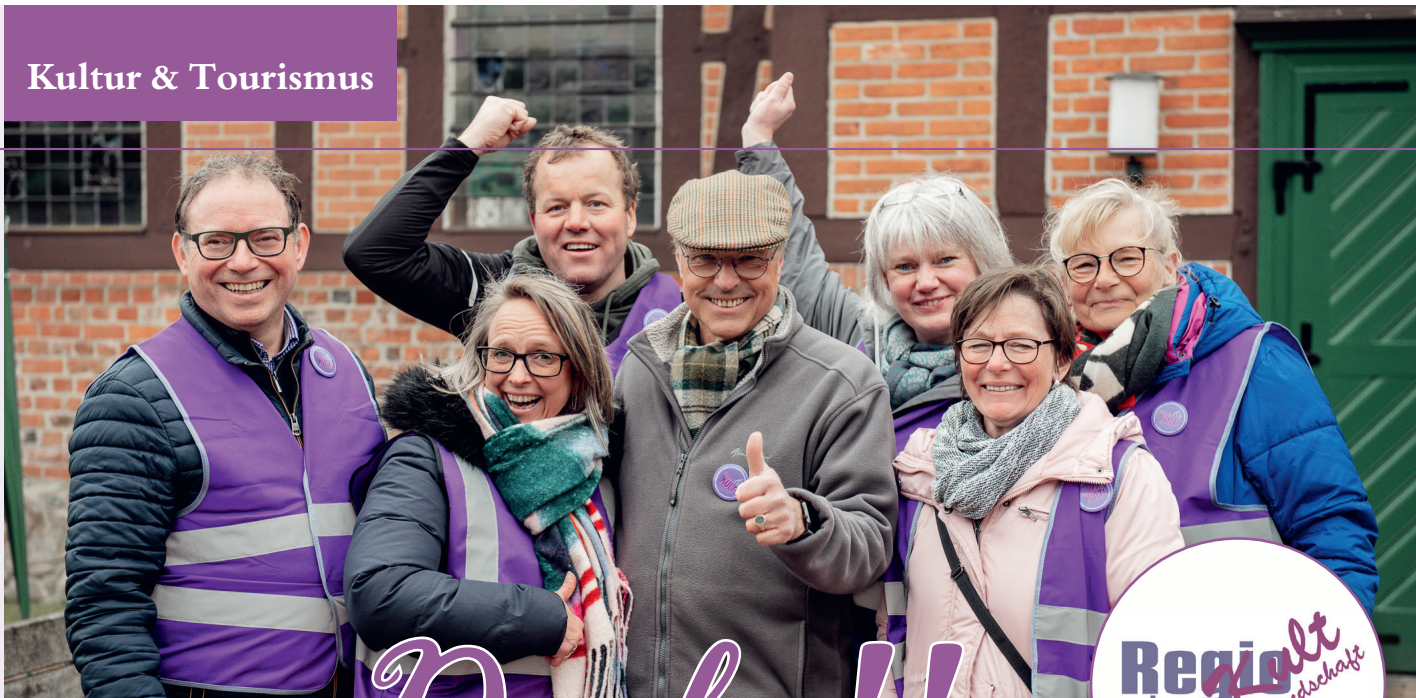
RegioKult Planungssteam FM