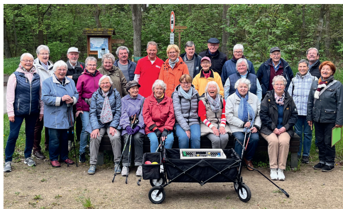
Mannschaftsbild (rot gegen gelb)