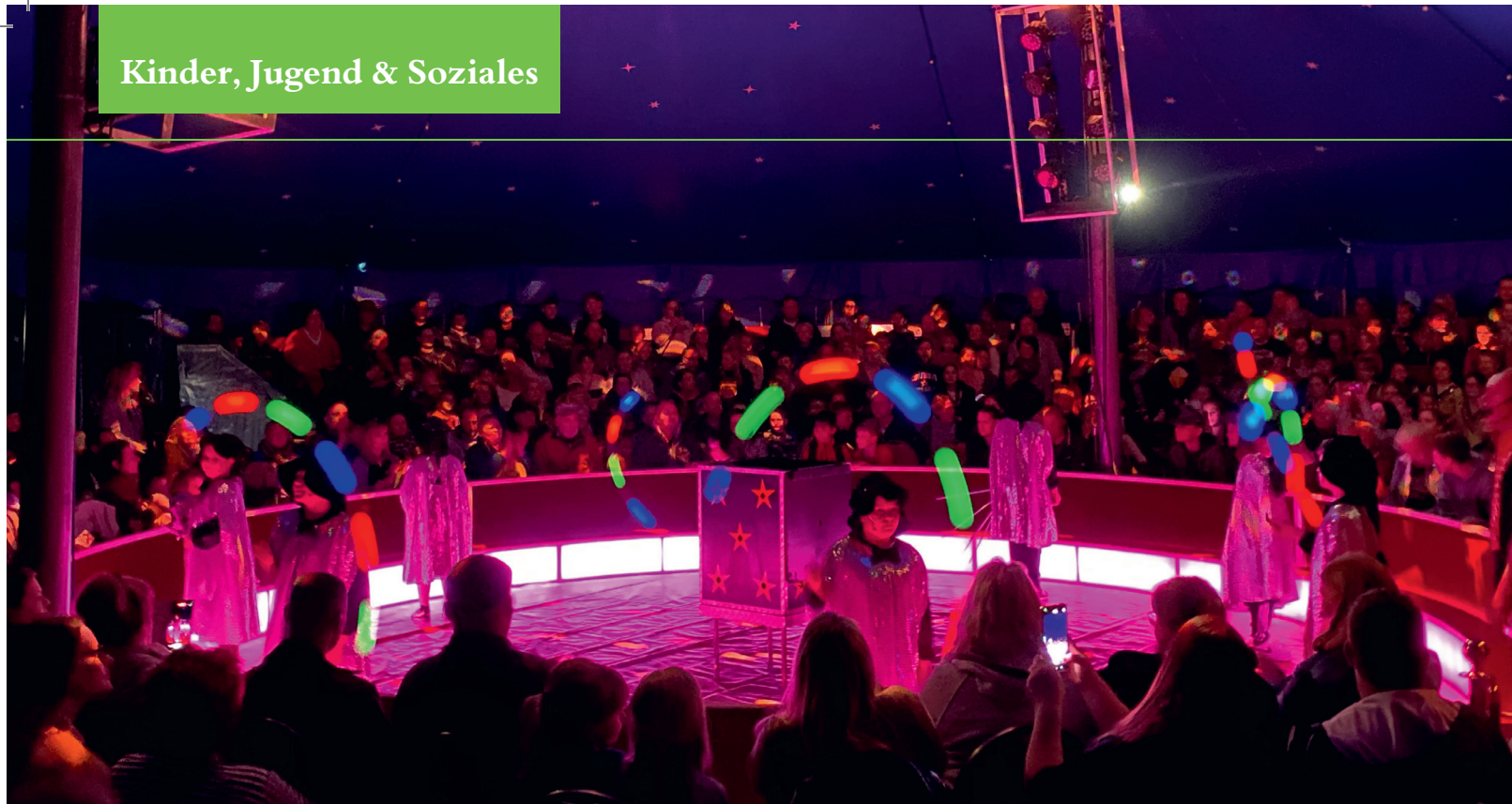
Vorstellung im Zirkus Rasch