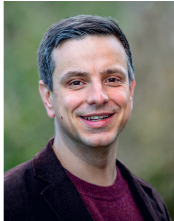
Martin Alex © Frithjof Plautz

Ich liebe Erdbeeren. Egal ob auf Eis, als Bowle, im Kuchen oder einfach so. Zum Glück ist der Weg zu frischen Erdbeeren bei uns nicht weit: In Niedersachsen werden im Vergleich zu allen anderen Bundesländern die meisten Erdbeeren im Freiland angebaut. Die ersten aus Deutschland sind auch schon zu haben. Übrigens vernascht jeder Deutsche pro Jahr durchschnittlich mehr als dreieinhalb Kilo. Und das mit gutem Grund: Erdbeeren sind gesund – haben mehr Vitamin C als eine Zitrone. Sie können Zellschäden reparieren und die Gedächtnisleistung steigern. All das hat eine Studie der Uni Rostock festgestellt. Die Probanden wiesen zudem bessere Blutdruck- und Cholesterinwerte auf. „Längeres Leben durch Erdbeeren?“ fragten daher einige Zeitungen.