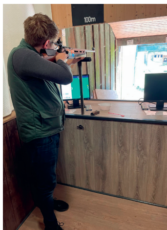
Kleinkaliber 100 m Bahn