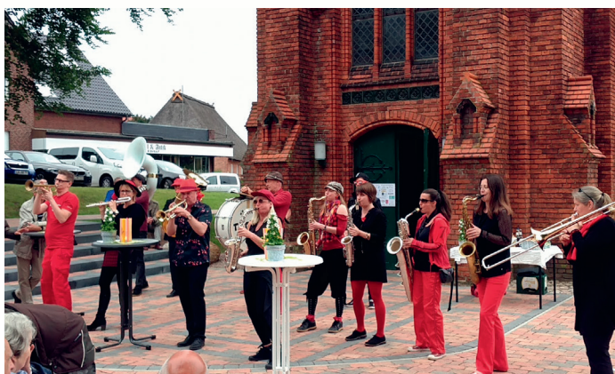
TÄTÄRÄ – die mobilste Band der Welt