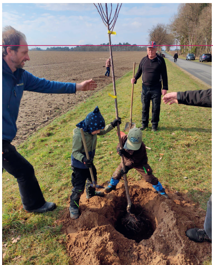
Auch die Jüngsten helfen tatkräftig mit.