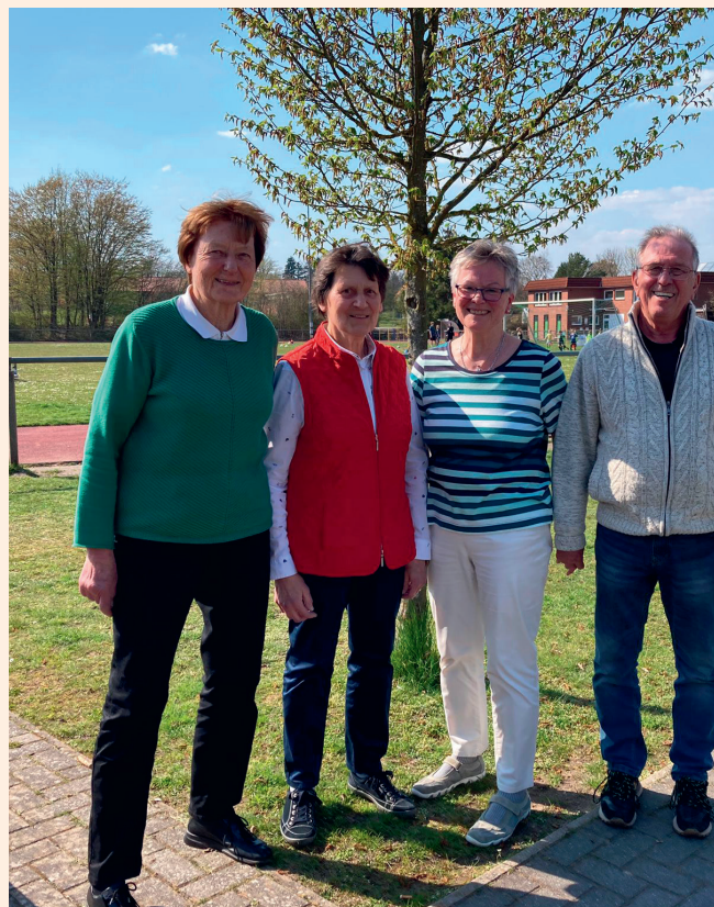
Der neue Vorstand