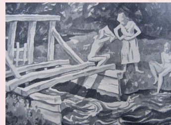
Badende Frauen am Lopauwehr