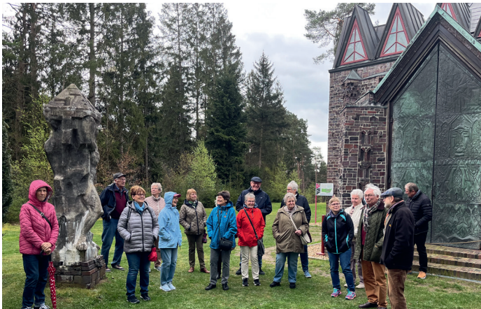
Wohn- und Atelierhaus