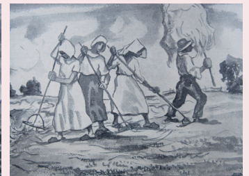
Heuernte im Juli

Durch seine im zunehmenden Alter immer schlechter werdende Sehkraft werden das Wechselspiel der Farben und die großzügige Lini- enführung in seinen Gemälden immer vor- dergründiger.