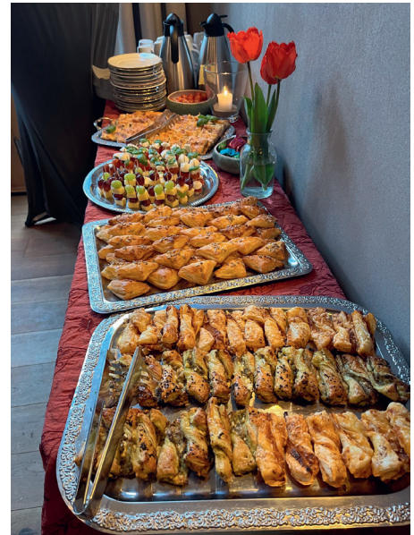
Super Catering

■ Kirstin Blanck, Landfrauen Amelinghausen