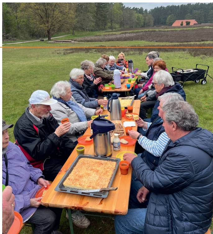
Kuchenbuffet in der Heide