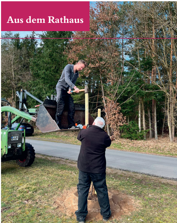
Gemeinsame Pflanzaktion neuer Obstbäume