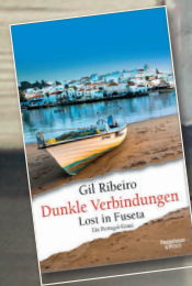
Dunkle Verbindungen Kiepenheuer & Witsch Verlag

1. Gil Ribeiro „Dunkle Verbindungen“ ist der sechste Fall um einen ungewöhnlichen Kommissar in der Reihe „Lost in Fuseta“ voller Spannung, Humor und portugiesischem Lokalkolorid.