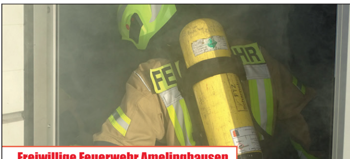
Freiwillige Feuerwehr Amelinghausen