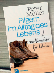
Pilgern im Alltag des Lebens Patmos Verlag

2. Kristina Hauffs Roman „In blaukalter Tiefe“ nimmt den Leser mit an Bord auf einen Segeltörn zu den wildromantischen schwedischen Schären. Eines Nachts bricht ein gefährlicher Sturm los und bringt die Bootsgesellschaft in tödliche Gefahr.