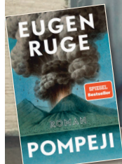
POMPEJI dtv Verlag