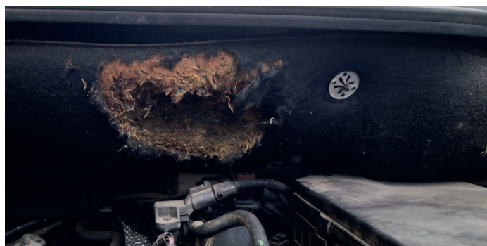
Marder unter der Motorhaube