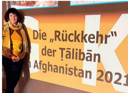
Referentin Dr. G. Krüger

Der Vortrag reichte u. a. von geografischen, geschichtlichen, religiösen, politischen, wirtschaftlichen und kulturellen Informationen bis hin zu den alten und neuen Unterstützern sowie den aktuell