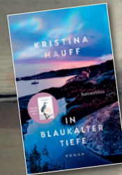
In Blaukalter Tiefe hanserblau Verlag

1. Gil Ribeiro „Dunkle Verbindungen“ ist der sechste Fall um einen ungewöhnlichen Kommissar in der Reihe „Lost in Fuseta“ voller Spannung, Humor und portugiesischem Lokalkolorid.