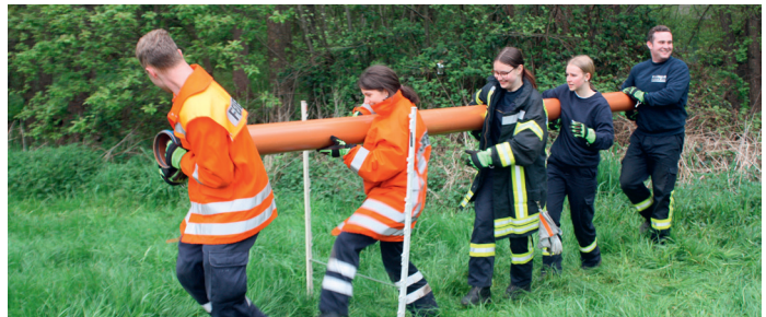
Die Feuerwehr Deutsch Evern an der Station der Neu-Oldendorfer