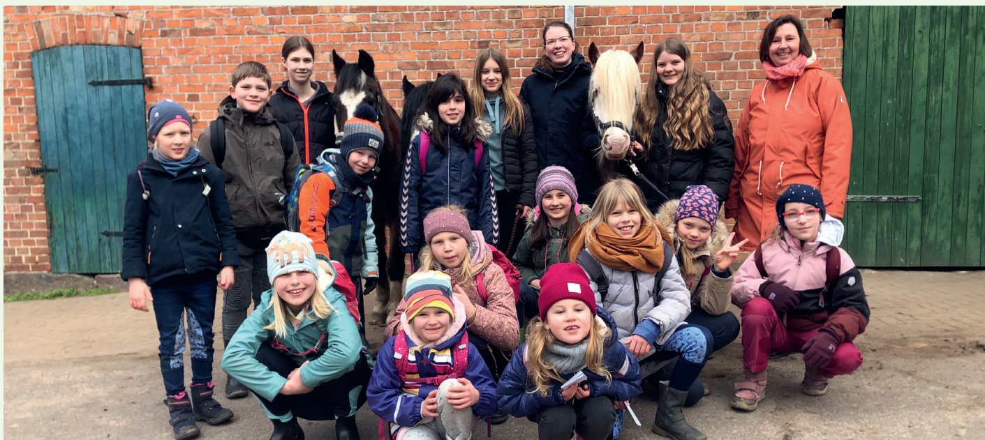
Toller Erlebnistag auf dem Lindenhof