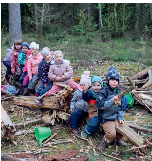
Die Walderoberung war erfolgreich