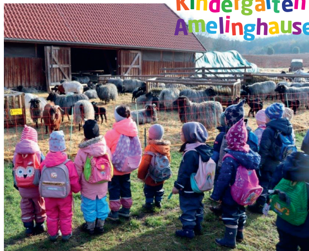
Besuch bei den Heidschnucken