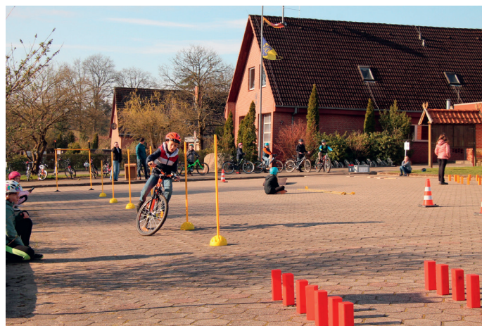
Bei der Slalomfahrt geht es neben der Sicherheit auch um das Tempo.

Auch die Schule kann hierfür ein Ort zum Üben sein. Dank der Initiative der Verkehrswacht verfügt die Grundschule Soderstorf seit diesem Jahr über einen eigenen Fahrradparcours. So hatten die Kinder eine Woche lang Zeit, bei kühlem, aber trockenem Wetter elementare Dinge für sicheres Radfahren zu üben wie Fahren über unebenen Grund, einhändiges Fahren, Spurwechsel mit Kontrollblick nach hinten, Slalom, unter einer Stange hindurchfahren und scharfes Bremsen. Die Kinder der 2. Klasse hatten Gelegenheit zu schnuppern, während die Schü-