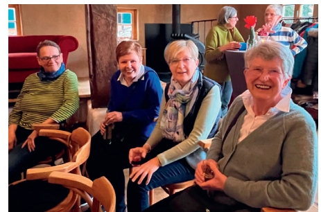
Interessierte LandFrauen