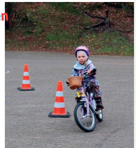
Fahrradprüfung auf dem Waldbadparkplatz