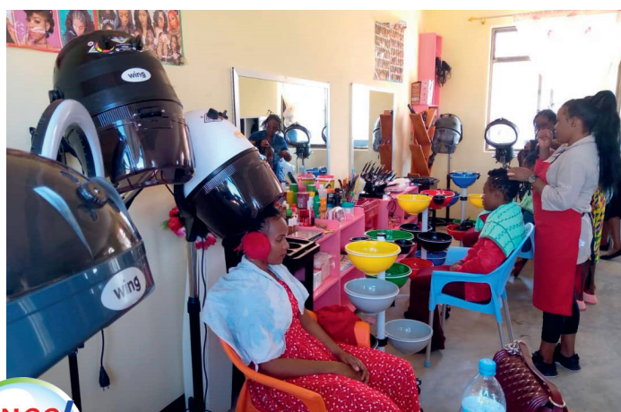
Impressionen der ersten Kursteilnehmer in der neuen Ausbildungswerkstatt bei SabaSaba.