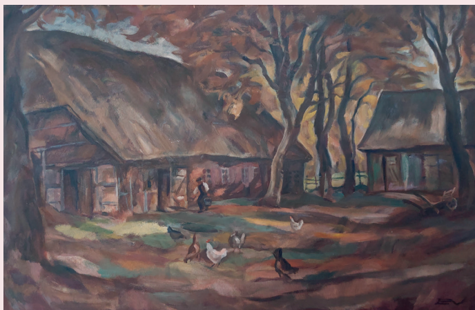
Um 1900 für einen Neubau abgerissen, heute „Rehlinger Hof“

Durch seine im zunehmenden Alter immer schlechter werdende Sehkraft werden das Wechselspiel der Farben und die großzügige Lini- enführung in seinen Gemälden immer vor- dergründiger.