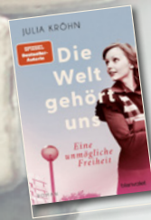
Die Welt gehört uns / Julia Kröhn / blanvalet Verlag