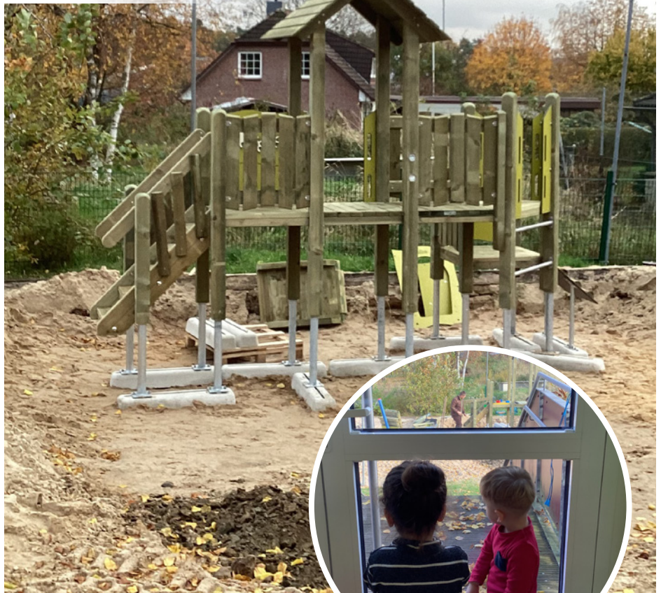
Baufortschritt am Tag 2