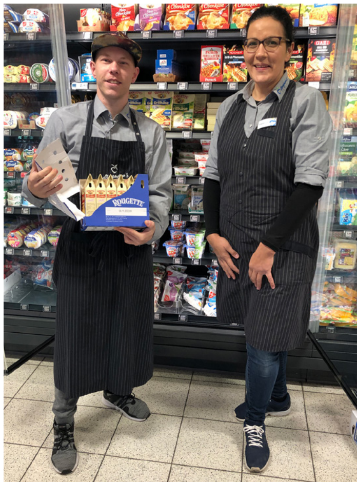
Schichtwechsel in der Molkereiabteilung von Edeka Bergmann