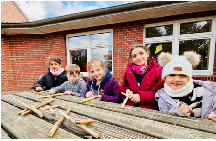
Bitte lächeln :-)