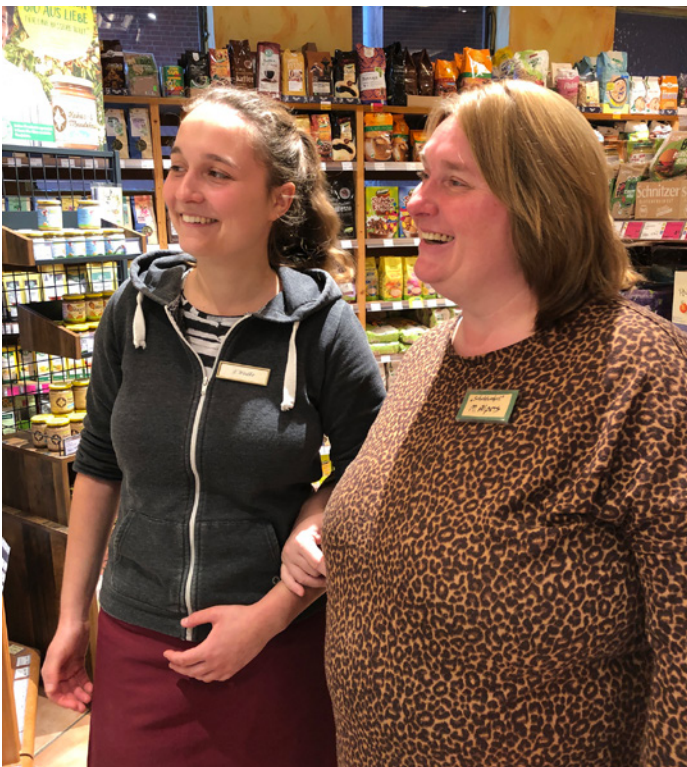
Schichtwechsel im Naturkostladen Häcklingen