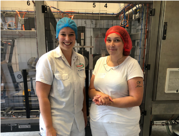
Schichtwechsel in der Hochwald Molkerei