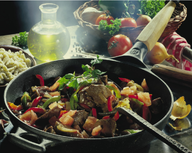
Rehragout, gesund, regional und bio

„Würstchen und Kartoffelsalat“ zu Heiligabend sind out. Warum nicht mal was Besonderes, das vor dem Kirchbesuch vorbereitet werden kann und danach schnell fertig zubereitet ist?