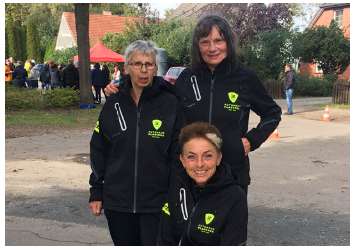
Erfolgreiches Team W60+