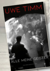
Alle meine Geister / Uwe Timm / Kiepenheuer&Witsch