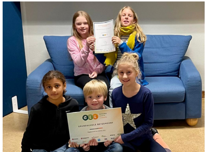
„Gesund leben lernen“