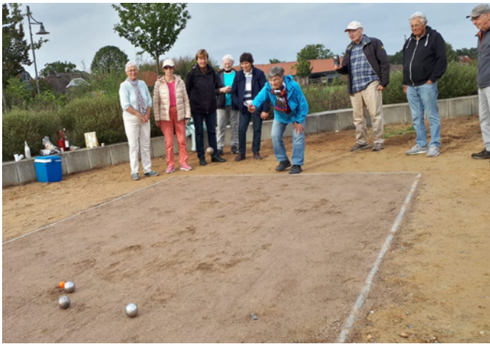
Einweihung der Boulebahn