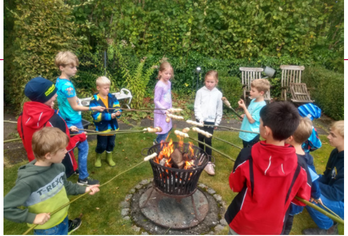
Stockbrot geht immer

Öffnungszeiten: Mo/Di/Do 8.00 – 18.00 Uhr Fr. 8.00 – 13.00 Uhr