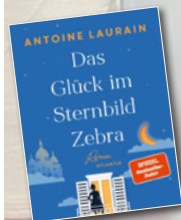
Das Glück im Sternbild Zebra / Antoine Laurain / Atlantik Verlag