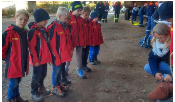
Aufgepasst beim O-Marsch