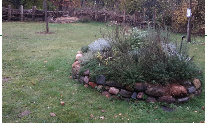
Garten der St. Godehard- Kirche