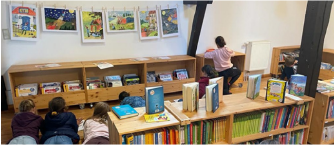
Geschichten schreiben in der Küsterscheune