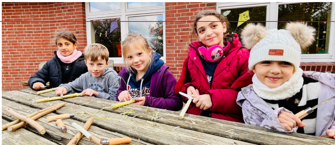
Unser Titelbild: Kinder der NSB Betzendorf beim Schnitzen