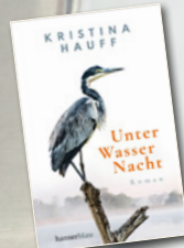
Unter Wasser Nacht/Kristina Hauff/ hanserblau Verlag