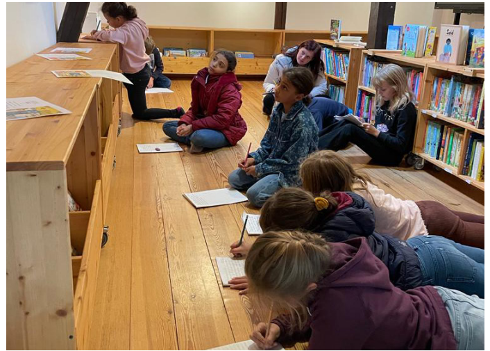
Geschichten schreiben in der Küsterscheune