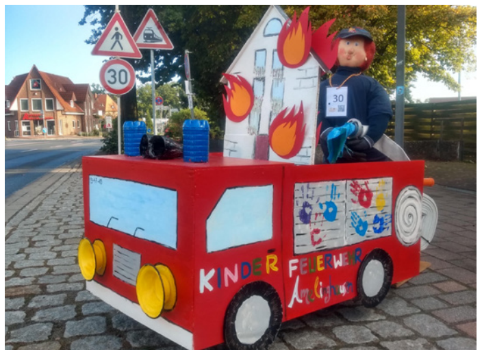
Unsere Schubkarre für den Herbstmarkt